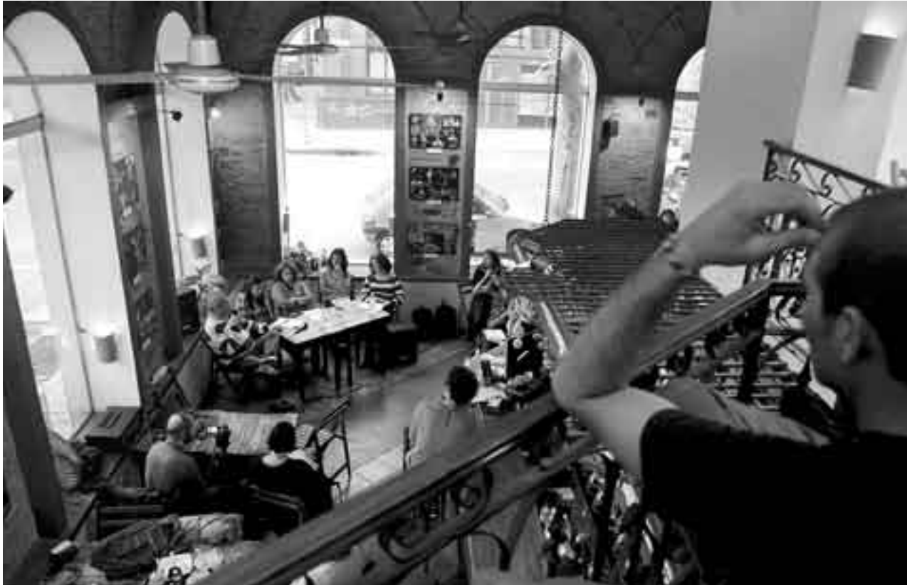
Conferencia "¿Otra radio y otra televisión son posibles?", el viernes en Café Kalima.