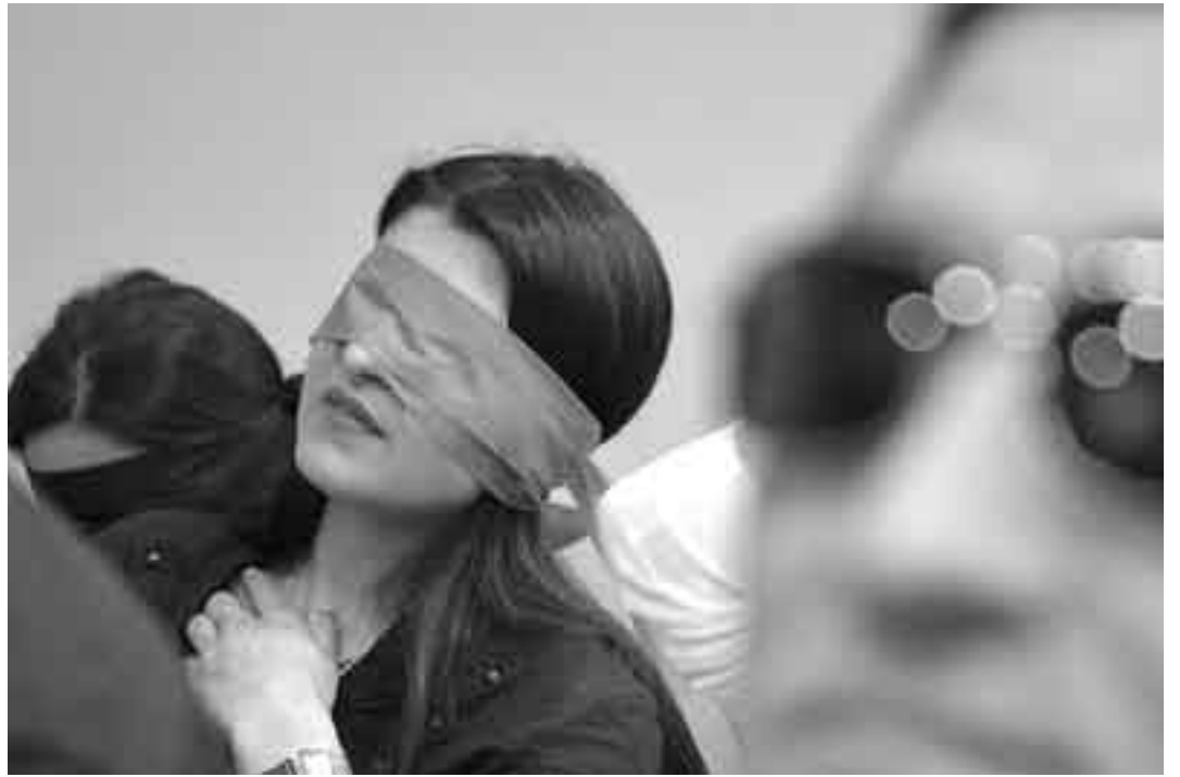
V Seminario Res Non Verba, el jueves, en el Centro de capacitación del Banco de Previsión Social.

El camionero se detuvo y se secó la transpiración. Pensó en su amante, en su novia o esposa. Demarco preguntó si la gente se movía, le respondieron que sí. Pidió que se batieran palmas con la música. Los presentes lo estaban disfrutando. “Imaginen una bebida que les guste y traten de sentir ese sabor”, continuó el guía, que sobre el final del viaje propuso reflexionar sobre “cómo nos comunicamos con nuestro entorno” ya que “todos percibimos el mundo