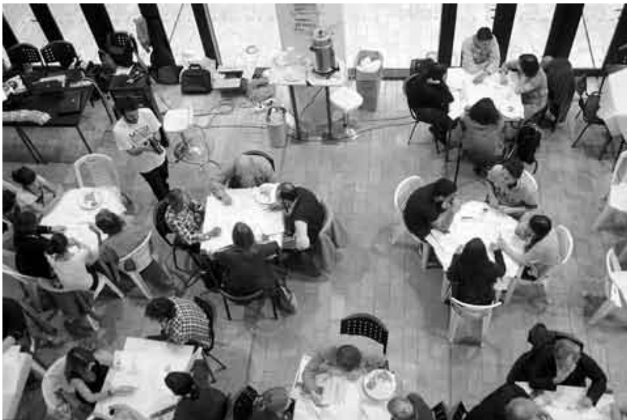
Actividad “¿Qué educación para qué sociedad?”, el viernes en la Facultad de Ciencias Sociales.