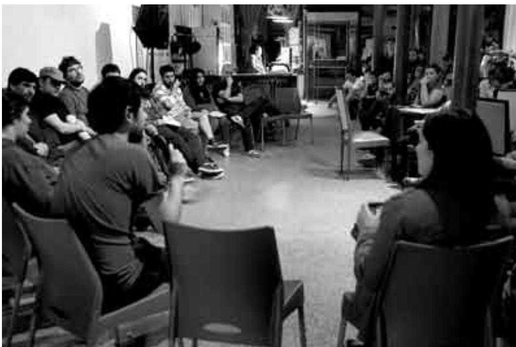
Segundo encuentro de literatura joven, el viernes en el Café La Diaria.

Hubo más de 100 anotados, aunque fueron unos 80 los que finalmente inscribieron sus escritos en alguna de las tres categorías establecidas: poesía, dramaturgia y cuento. Además de la cita del viernes 8, la movida incluye un concurso -cuyos resultados se